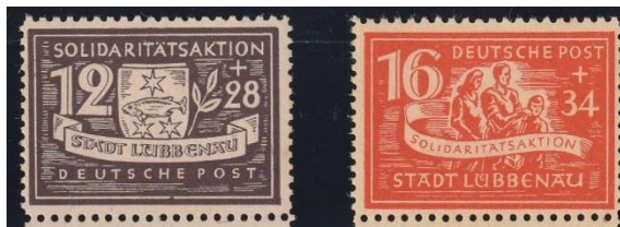
S 11 + 12

Die Ausgaben von Großräschen kann man ebenfalls mit in das Betrachtungsbiet einbeziehen . Wir werden auch eventuell dieses Gebiet mit be-fahren. Lokalausgaben Großräschen ist ein eigenständiges Sammelgebiet zum Thema Berg-bau und sehr speziell und schon oft beschrieben. In den folgenden Abb.S10 – 12 sind einige Werte dargestellt.