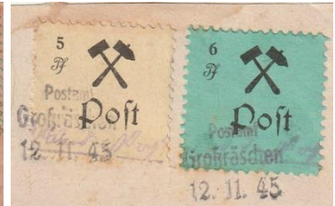
Ausgabe vom September 45 linkes und Ausgabe vom Okt/Nov. 1945 rechts.

Von der Ausgabe Okt Nov .45 unterscheidet man 4 Typen und eine Vielzahl von Zähnungsvarianten.